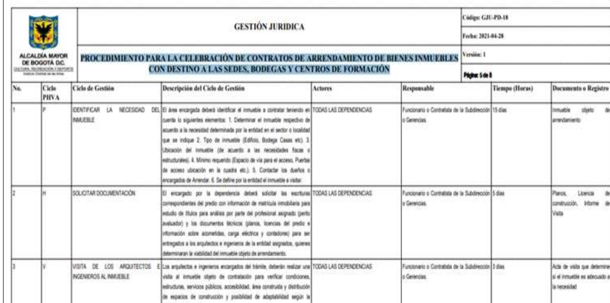
Imagen No. 3 Procedimiento para la celebración de contratos de arrendamiento