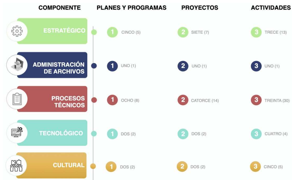
Ilustración 2. Ficha descripción de los proyectos por componente

El Plan Institucional de Archivos (PINAR) contiene cinco (5) componentes, dieciocho (18) planes y programas, veintiséis (26) proyectos y cuarenta y tres (43) actividades, las cuales se desarrollarán a corto, mediano y largo plazo: