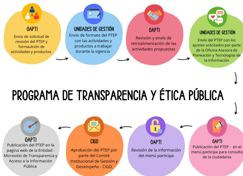
Ilustración 4 Formulación PTEP