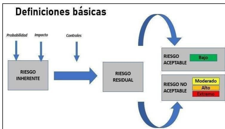
Figura 4. Aceptación de riesgo