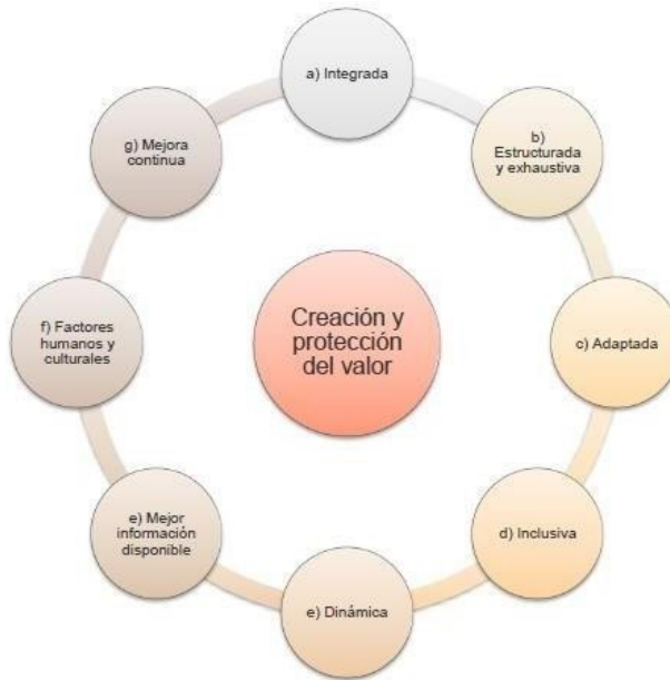
Figura 1. Principios. Norma ISO 31000:2018