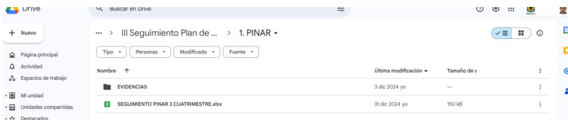
Imagen No. 2. Ejemplo archivo Excel de Plan Estratégico