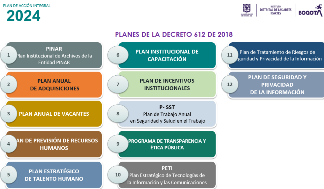
Imagen No. 1. Índice Plan de Acción Integral 2024

Seguido de esto la Oficina Asesora de Planeación y Tecnologías de la Información, solicitó a través del comunicado fechado 4 de diciembre de 2024 con asunto “Cronograma programación y reporte de Instrumentos de Planeación” y Radicado: 20241200685113 enviado por correo electrónico y Orfeo a las unidades de gestión, el reporte de las actividades y acciones con las respectivas evidencias que dan cuenta de su avance o ejecución respectiva.