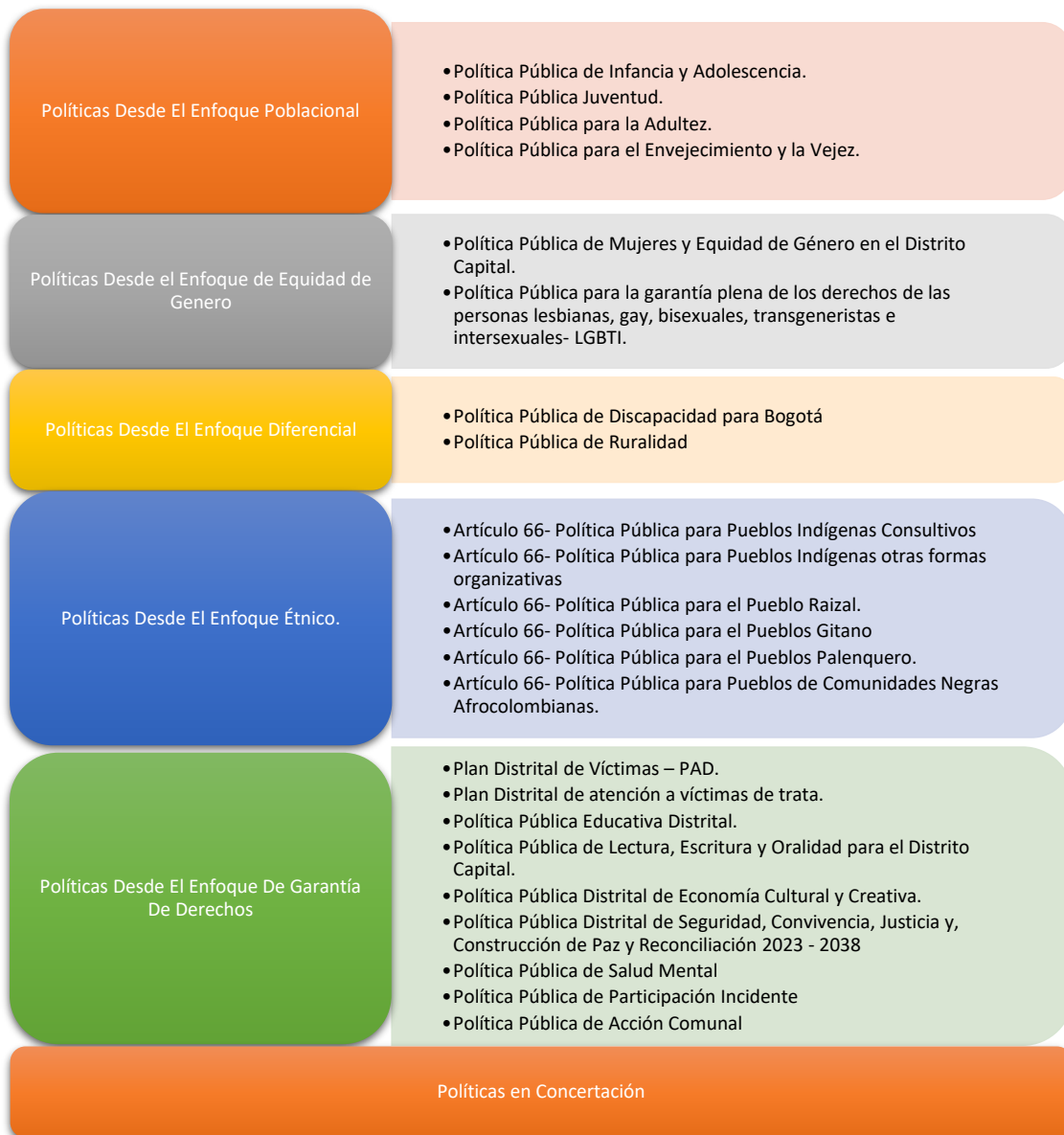
Esquema 1. Agrupación de Políticas por enfoque