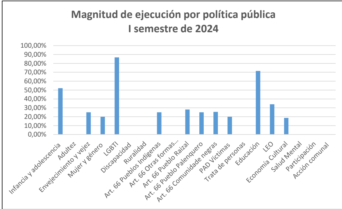
Gráfica 2: Magnitud alcanzada en ejecución por política pública Fuente: Elaboración Idartes, 2024.

La gráfica 2 muestra, en términos generales, un avance promedio de implementación del 21,58%, lo cual invita a generar estrategias institucionales desde las unidades de gestión para garantizar el cumplimiento de las metas al cierre de la vigencia. Como se mencionó anteriormente, las políticas de Adultez, Discapacidad, Ruralidad, Trata de Personas, Salud Mental, Participación Incidente, Acción Comunal y las acciones afirmativas para Indígenas en otras formas organizativas, se encuentran en un avance cuantitativo de 0%, en algunos casos debido efectivamente a la falta de avance en la implementación, pero en otros casos debido a la naturaleza del producto que requiere fases administrativas que se han venido desarrollando como elementos previos necesarios para conseguir la implementación de los productos y que no son tomadas en cuenta en los seguimientos cuantitativos dada la forma de medición del producto.